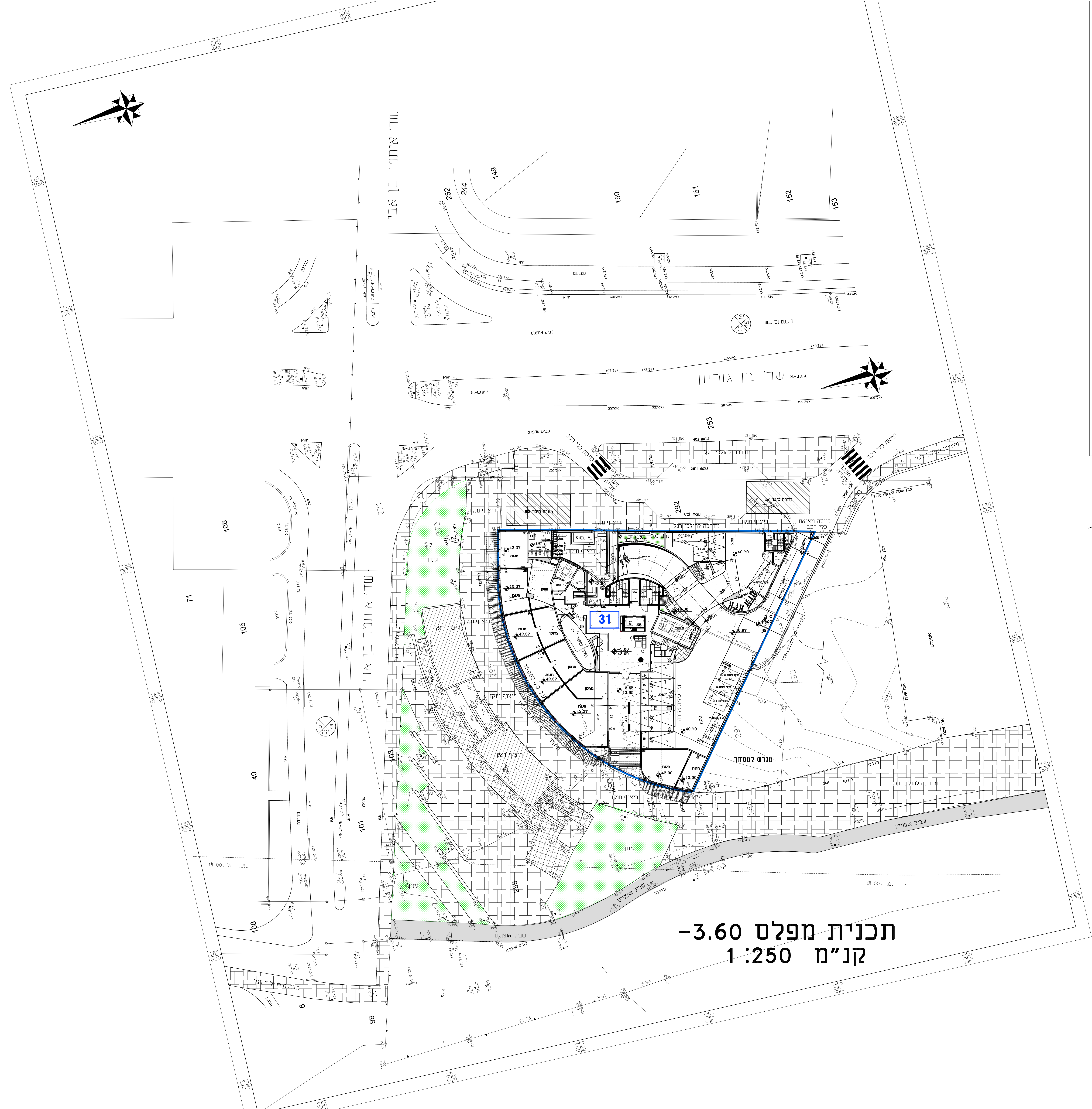
תכנית מפלס -3.60 קנ"מ 1:250