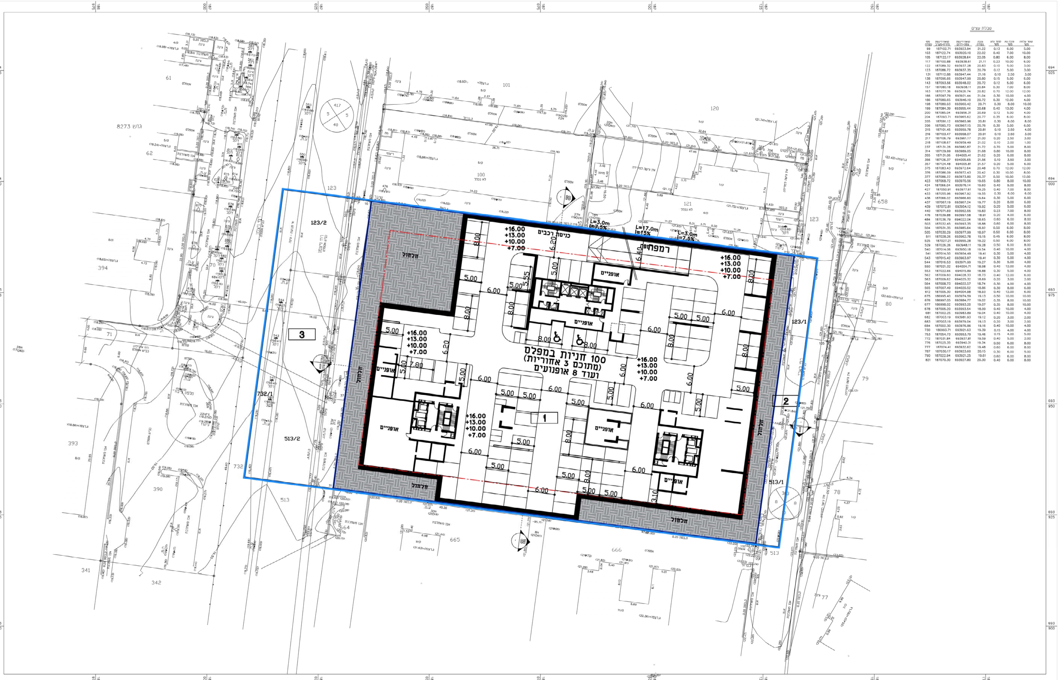
תכנית קומות מרתף 1, -2, -3, -4