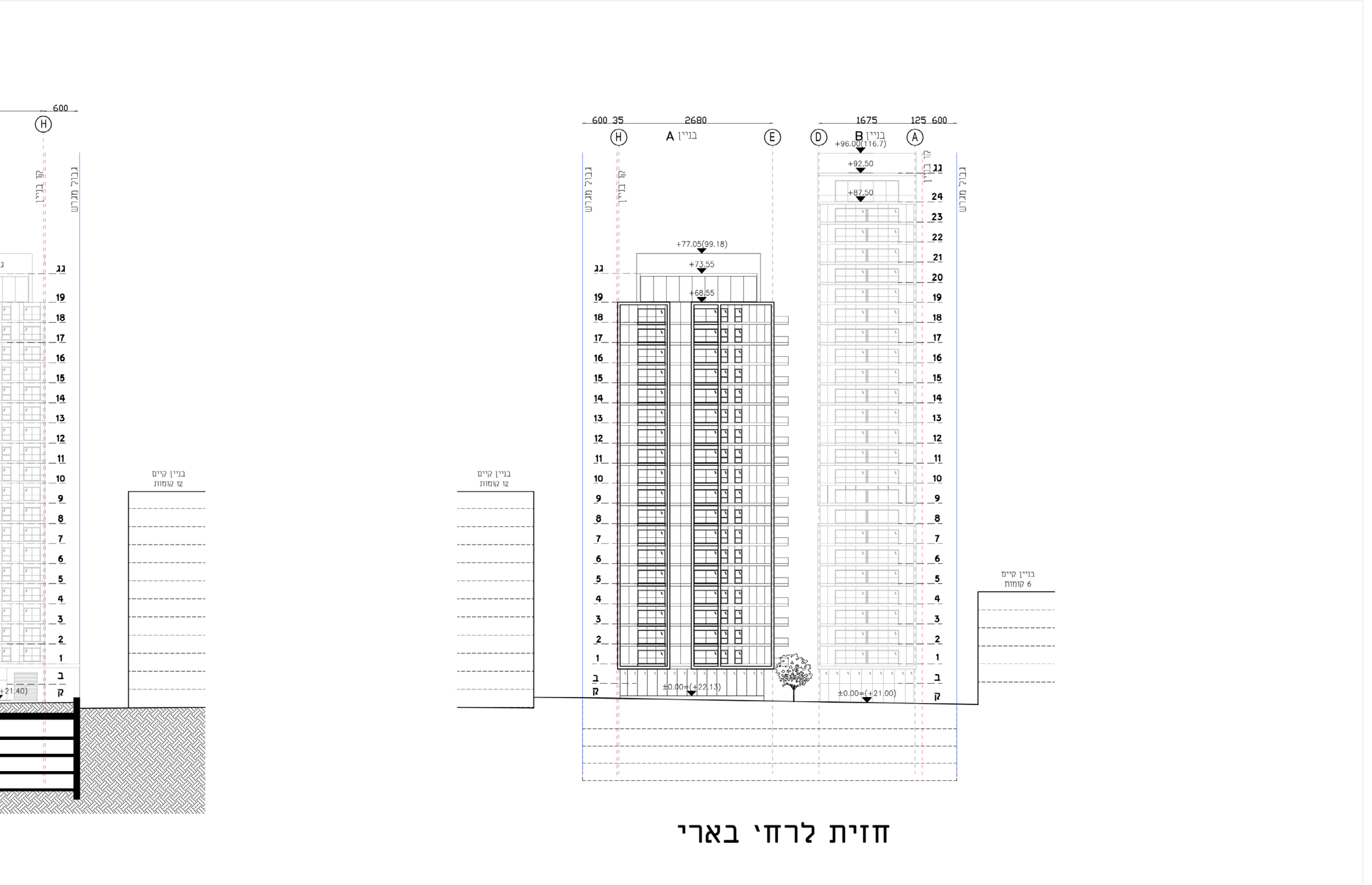
חזית לרחי בארי