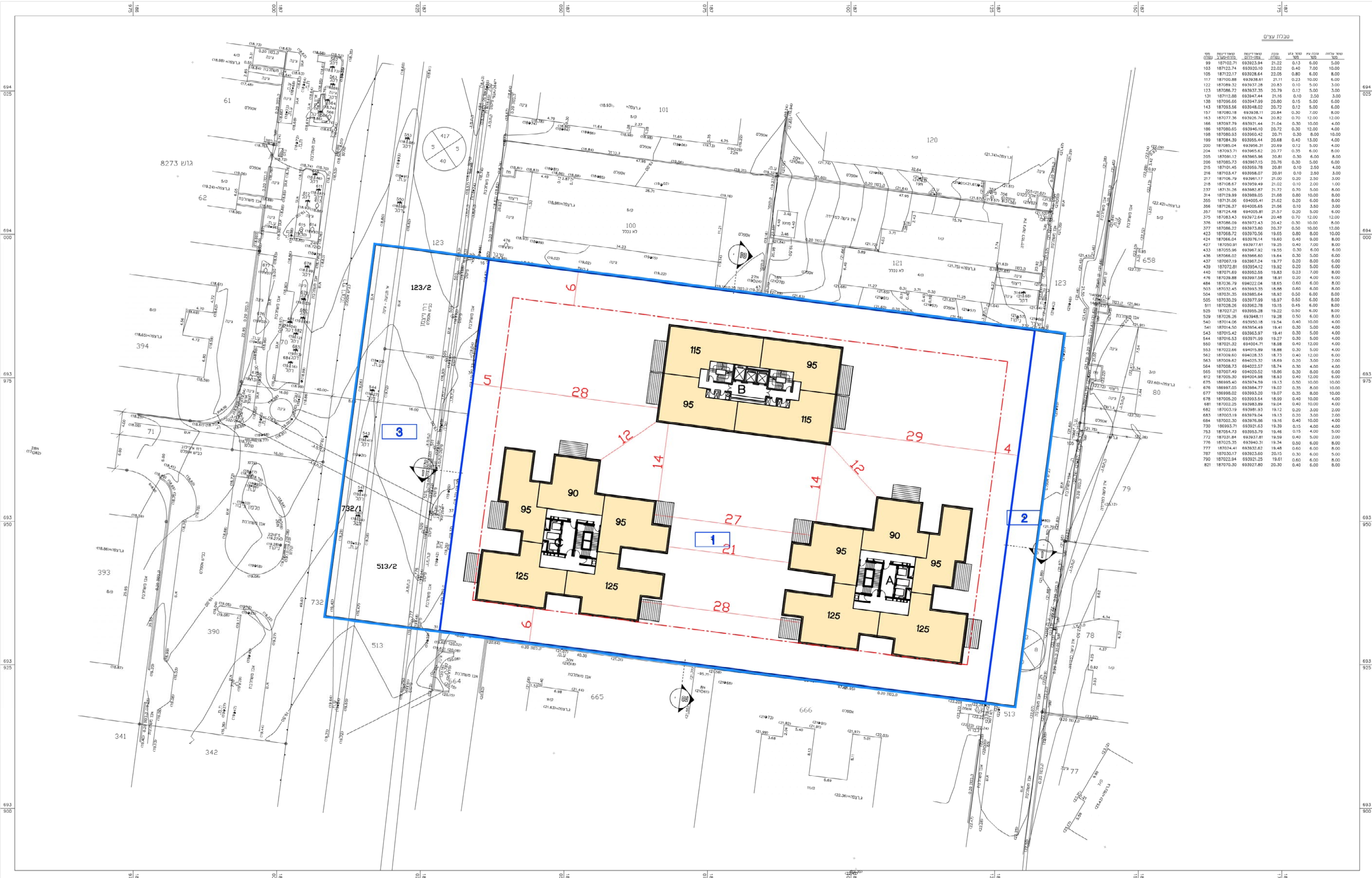
תכנית קומה טיפוסית