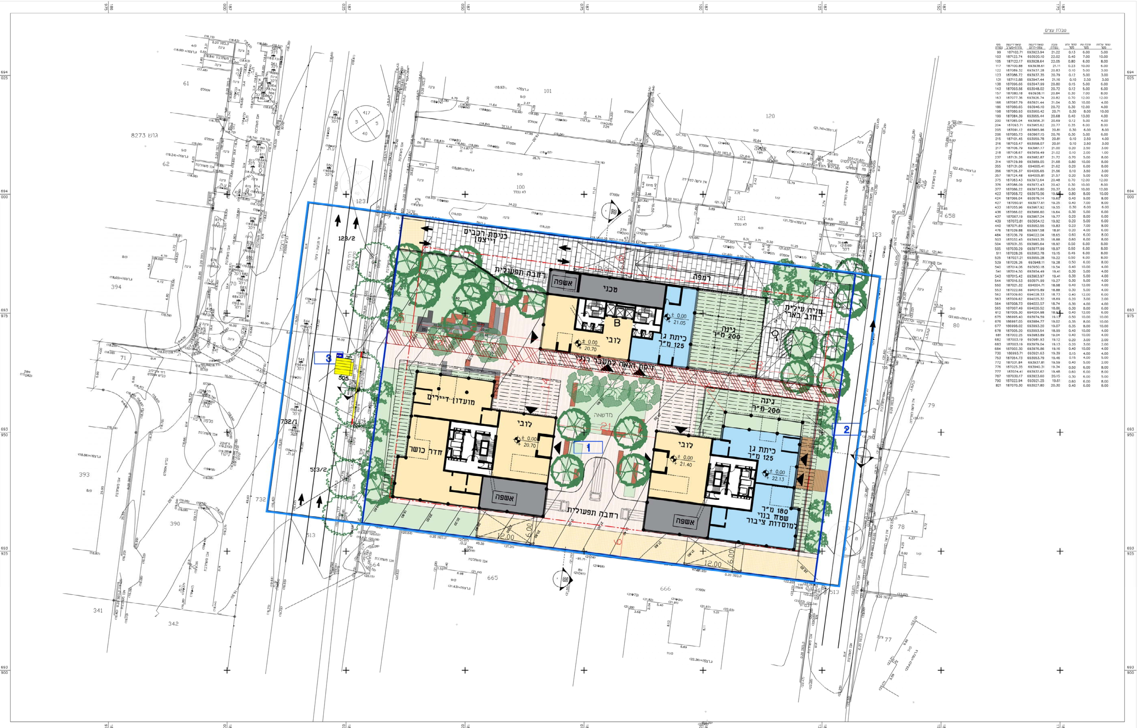
תכנית קומת כניסה