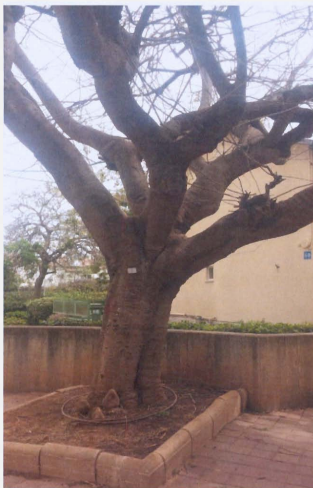
עץ חס' 1 - צאלון - שימור