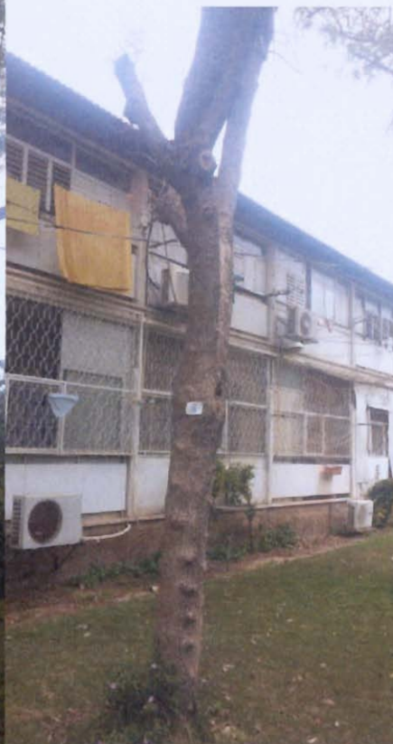
עצים מס' 6, 7 מכנף - שימור