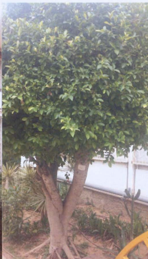
עצים מס' 12, 13 פיקוס, ברוש - כריתה