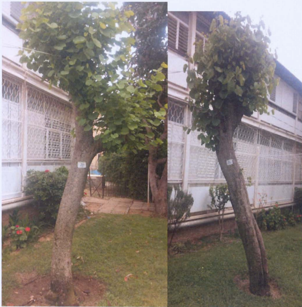
עצים מס' 14, 15 בוהיניה - כריתה