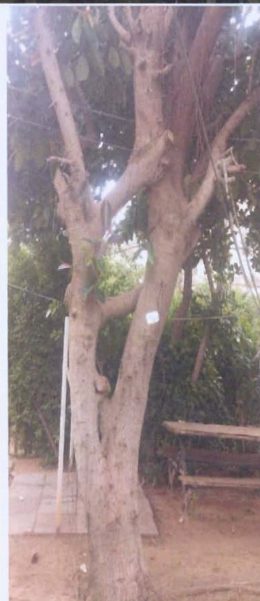
עצים מס' 16, 17 פיקוס - שימור עץ מס' 18 ושינגטוניה - שימור