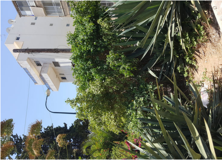
עץ מס' 1