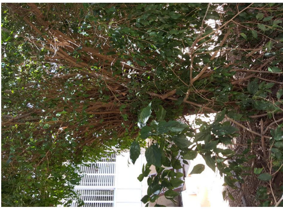
עץ מס' 13