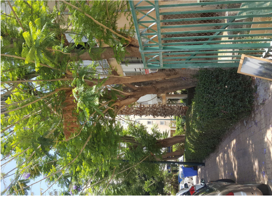
עץ מס' 5