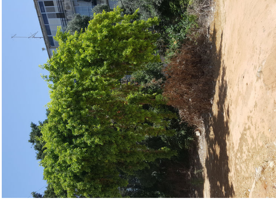
עץ מס' 10