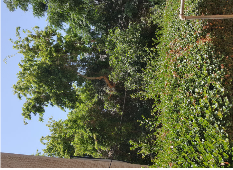
עץ מס' 14