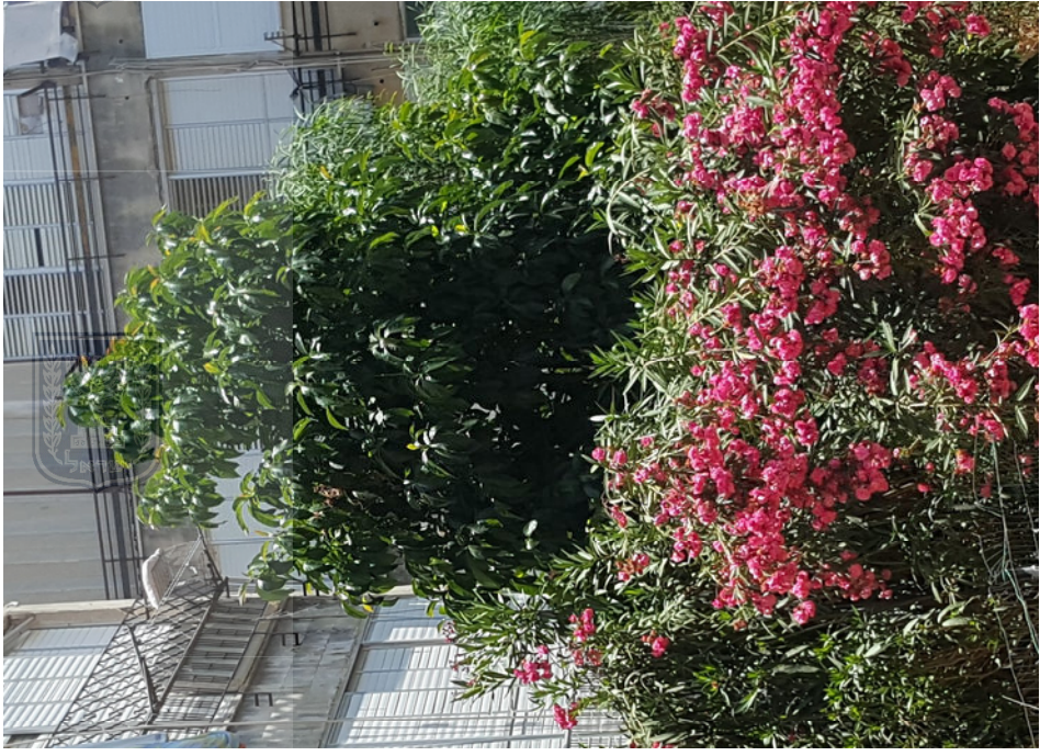
עץ מס' 6