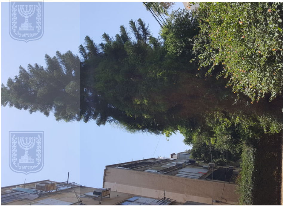
עץ מס' 7