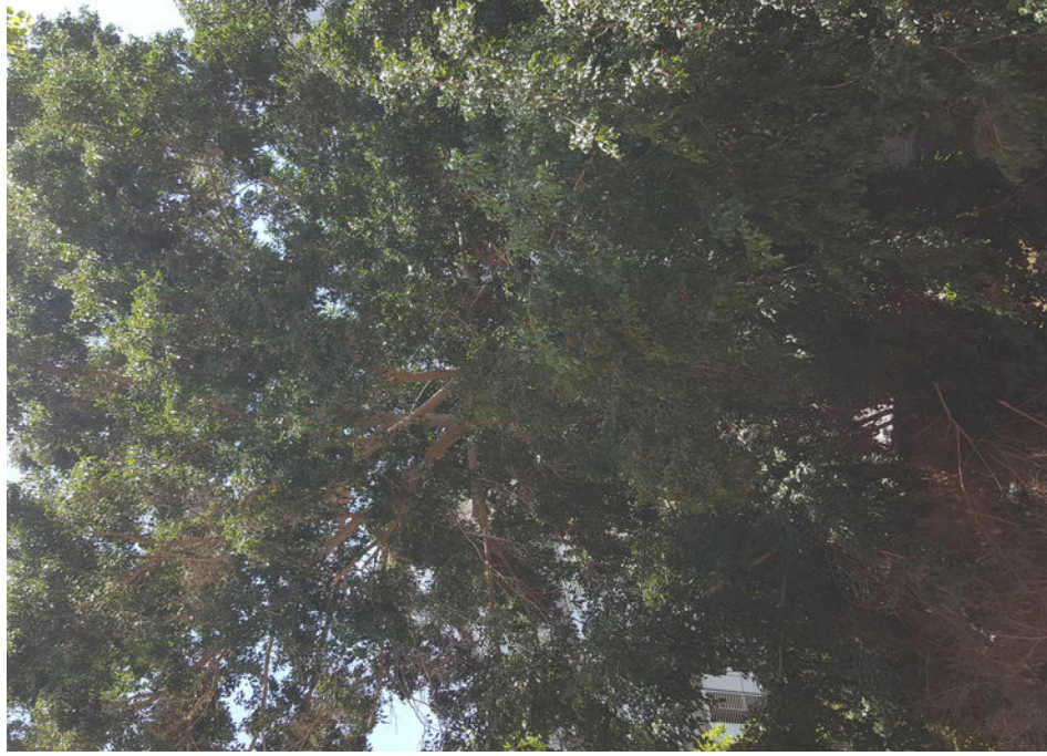
עץ מס' 8