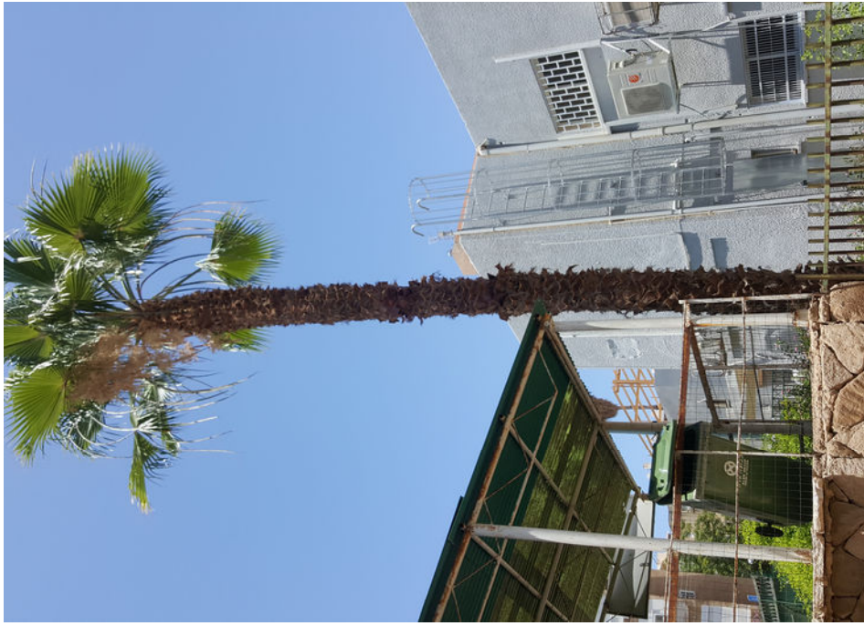
עץ מס' 16