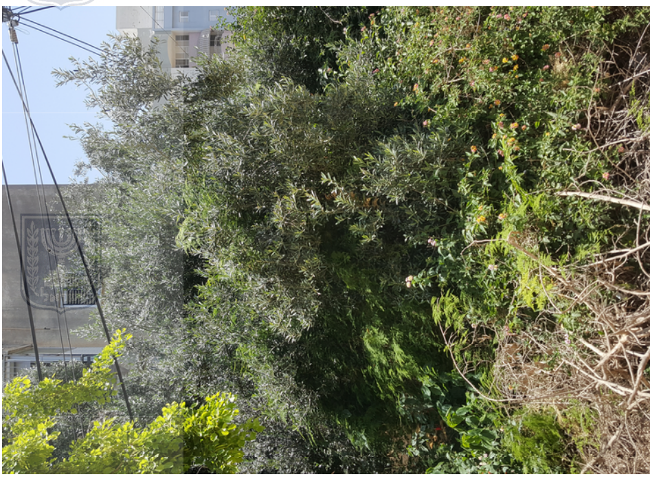
עץ מס' 15