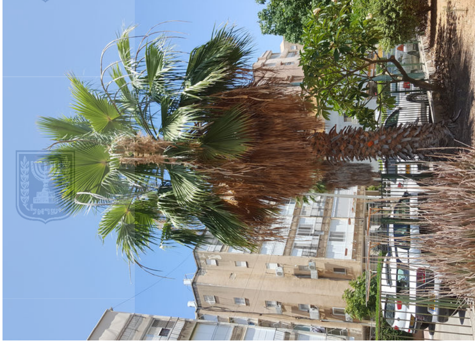
עץ מס' 2