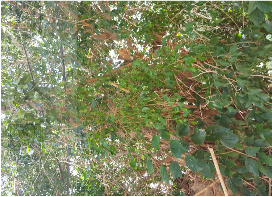
עץ מס' 12