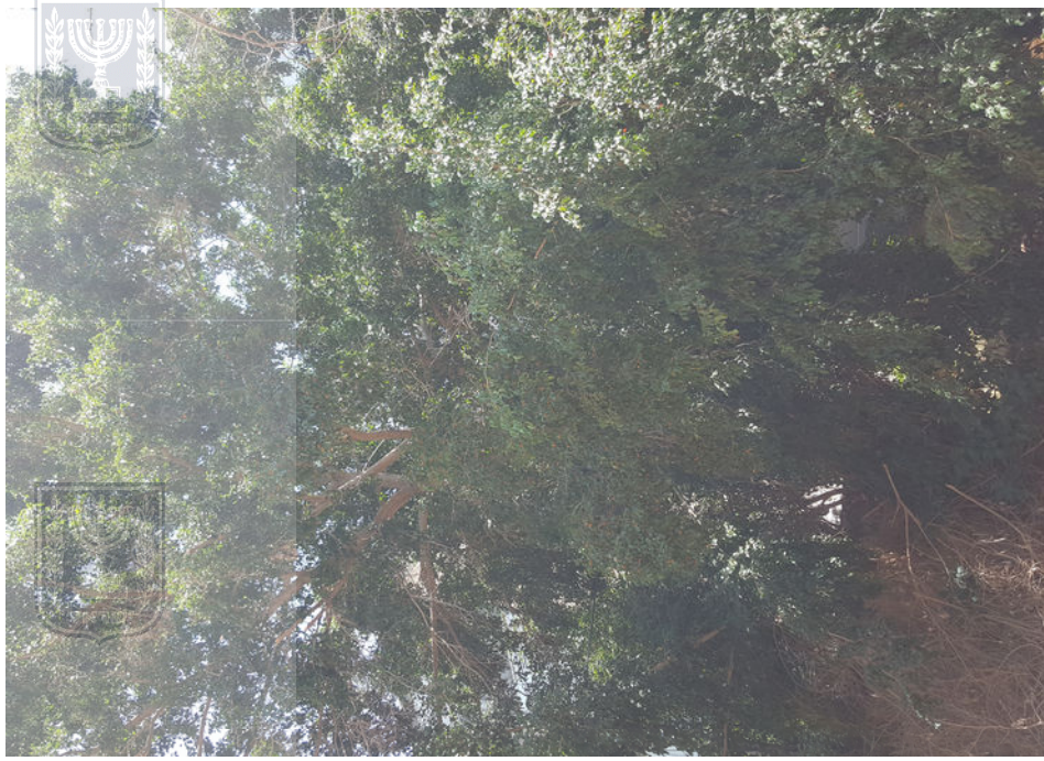
עצים 12 ו-13