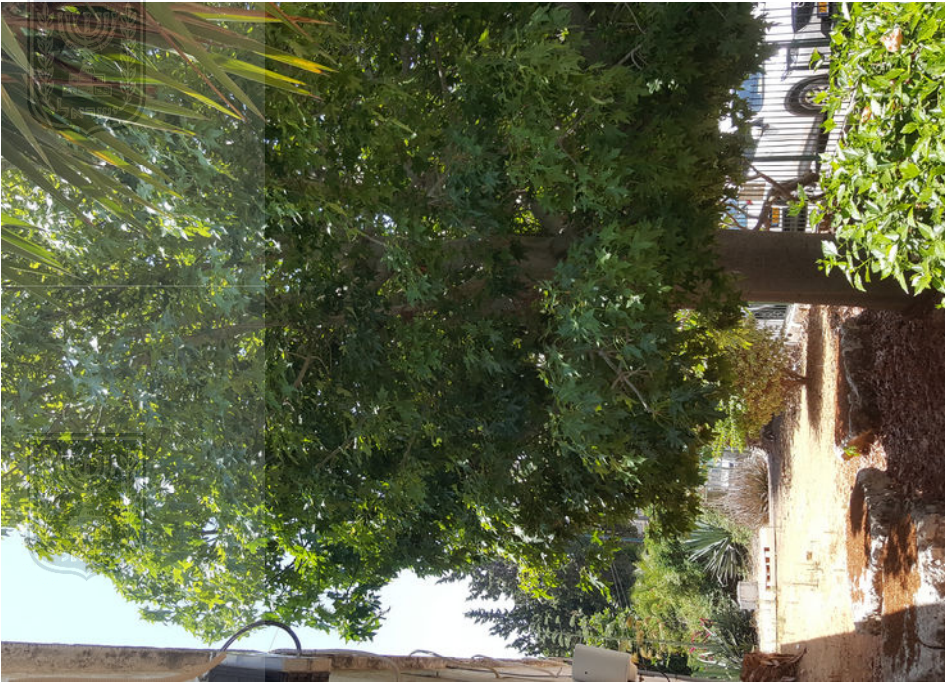
עץ מס' 3